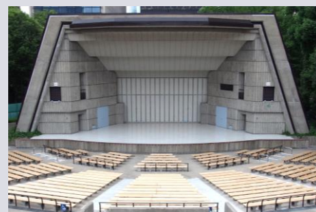
三代目(現在の野音)

1923年（大正12年）7月に開設 日本で最初の本格的な野外音楽堂だと言われている 同年9月に起きた関東大震災にも耐え被災した人々を音楽で癒した 当時は、舞踊（ダンス）や野外劇など音楽会以外の催事も開催されていた